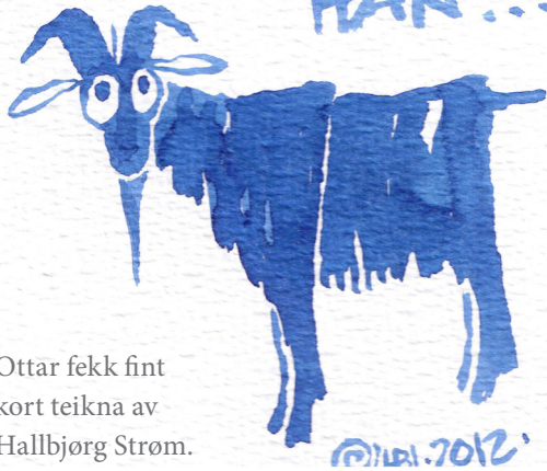
Ottar fekk fint kort teikna av Hallbjørg Strøm.