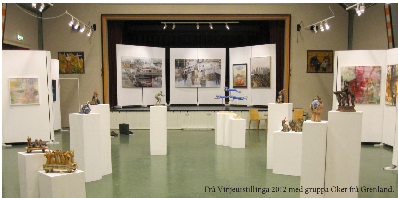
Frå Vinjeutstillinga 2012 med gruppa Oker frå Grenland.